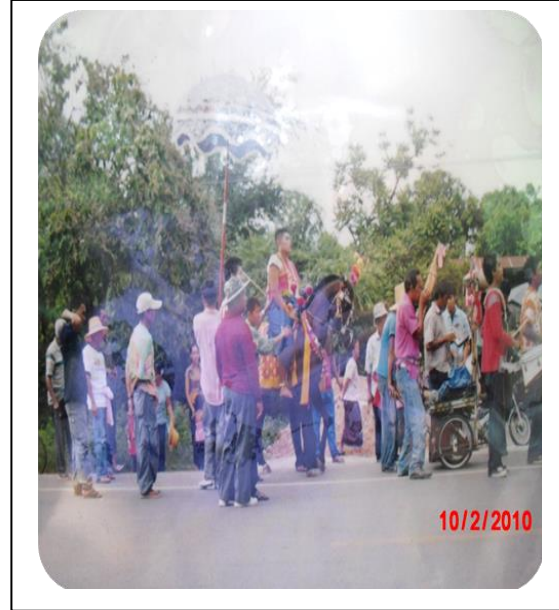
ภาพประกอบที่ - : หลังจากทำพิธีบวชแล้วลูกแก้วนั่งบนหลังม้าเพื่อทำพิธีแห่รอบหมู่บ้าน