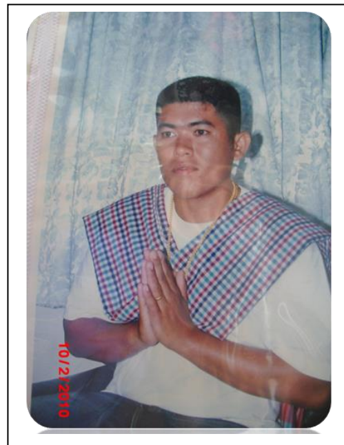
ภาพประกอบที่ - : ลูกหลานชาวมอญบ้านรวมม่วง อำเภोजอมบึงในประเพณีบวชลูกแก้ว