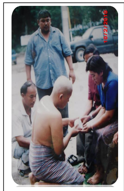
ภาพประกอบที่ - : นาคหรือลูกแก้วทำพิธีรดน้ำปิตามารดาหลังจากปลงผมแล้วทำพิธีบวชโดยสวมชุดสีส้มสวยงาม