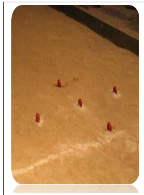
ภาพประกอบที่ - : หญิงชาวมอญเล่นสะบ้าในงานประเพณีและตำแหน่งของลูกสะบ้าในการตัดสินคะแนน