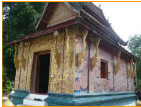
วิหารแดง

ถัดมาบริเวณด้านข้างและด้านหลังของพระอุโบสถเป็นที่ตั้งของวิหารเล็ก ๆ 2 หลัง จุดเด่นของวิหารด้านหน้าคือ ที่ผนังด้านนอกแต่ละหลังตกแต่งด้วยกระจกสีตัดเป็นชิ้นเล็ก ๆ แล้วนำมาต่อกันเป็นรูปร่างต่าง ๆ เล่าเป็นนิทานพื้นบ้านลงบนผนังสีชมพู ดูสวยงามน่ารักตามแบบฉบับชาวหลวงพระบางเลยทีเดียว วิหารหลังเล็กด้านข้างพระอุโบสถที่มีชื่อว่า “ วิหารแดง ” ภายในเป็นที่ประดิษฐานพระพุทธรูปปางไสยาสน์ที่งดงาม ด้วยพระหัตถ์ที่รองรับพระเศียรไว้อย่างสง่างามและอ่อนช้อย พระพุทธรูปนี้เคยนำไปจัดแสดงที่กรุงปารีส ประเทศฝรั่งเศสในปีพ.ศ. 2474 และไปประดิษฐานอยู่ที่นครเวียงจันทน์หลายสิบปี ก่อนนำกลับมายังหลวงพระบางในปีพ.ศ. 2507