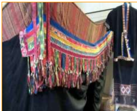
การจัดแสดงเครื่องนอนของกลุ่มชาติพันธุ์ทำ : วัสดุที่นอนที่ทำด้วยมือแบบดั้งเดิม ที่ถูกนำมาสร้างสรรค์ใหม่ในรูปแบบห้องนอนไทดำรวมทั้งมุ้งกันยุงที่ทำด้วยมือ

กลุ่มชาติพันธุ์ไทดำ : ไทดำเป็นกลุ่มชาติพันธุ์ที่สำคัญกลุ่มหนึ่งในประเทศลาว แม้ว่าไทดำจะเป็นกลุ่มชนที่อาศัยในดินแดนลาว ไทย และเวียดนาม ทว่าการใช้ภาษาและการรักษาวัฒนธรรมประเพณีของชาวไทดำใน 3 พื้นที่มีแตกต่างกัน