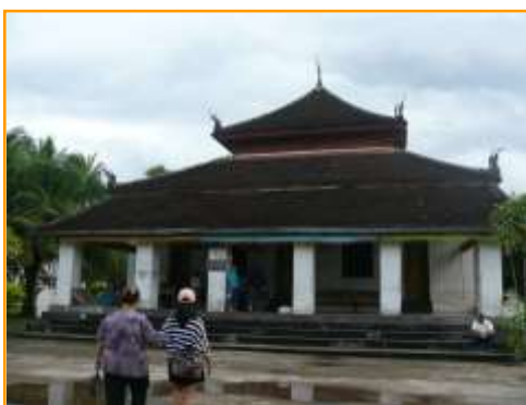
พระอุโบสถวัดวิขุนราช

วัดที่สองที่ไปชม คือวัดวิขุนราช หรือ วัดหมากโม หรือ วัดพระธาตุหมากโม ตั้งอยู่ทางทิศตะวันออกเฉียงใต้ของเมืองหลวงพระบาง ถนนวิขุนราช ค่าเข้าชม 20,000 กีบ (80 บาท) เปิดเวลา 07.00 -17.30 น. มักคุเทศก์ให้ข้อมูลเกี่ยวกับวัดนี้ว่า สร้างขึ้นในตอนต้นของศตวรรษที่ 16 ปี พ.ศ. 2046 ในสมัยพระเจ้าวิขุนราช พระองค์นำเอาไม้จากป่าที่ศักดิ์สิทธิ์ จำนวน 4,000 ท่อน มาสร้างวัดเพื่อให้เป็นวัดที่สวยงามที่สุด และแกะสลักไม้ทั้งหลัง ในสมัยก่อนผนังด้านนอก ด้านใน เสาแต่ละต้นเป็นไม้ทั้งหมด ปัจจุบันวัดนี้มีอายุประมาณ 500 กว่าปี แต่น่าเสียดายที่ถูกจีนฮ่อทำลาย ภายหลังได้มีการบูรณะซ่อมแซมขึ้นมาใหม่โดยเปลี่ยนเสาทั้งหมดเป็นเสาปูน และโครงสร้างเป็นปูน