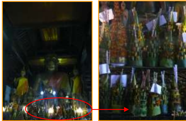
องค์พระประธาน ชันดอกไม้ ชันคูปี และชันสี่สิบห้า

เก็บรวบรวมมาจากวัดร้างต่างๆ ในหลวงพระบาง เช่น พระพุทธรูปสำริด พวกไม้จำหลักลวดลายต่างๆ พระพุทธรูปไม้แกะสลักลงรักปิดทองสูงเท่าคนจริงจำนวนมาก