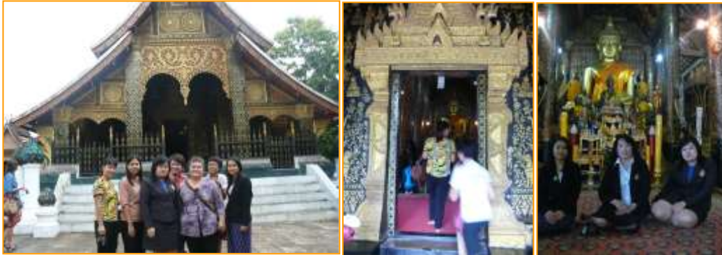
ด้านหน้าพระอุโบสถ

เมื่อเดินเข้าต่อมาที่ประตูพระอุโบสถจะสะดุดตากับลวดลายแกะสลักอันสวยงามเช่นเดียวกับที่หน้าต่าง ผนังภายในก็สวยงามด้วยลวดลายปิดทองฉลุลิบนพื้นรักสีดำ เล่าเรื่องพุทธประวัติพระสุธนมโนราห์ ทศชาติชาดกและภาพนิทานเพื่อนบ้าน ลึกเข้าไปคือพระประธานซึ่งมีชื่อว่า “พระองค์หลวง”