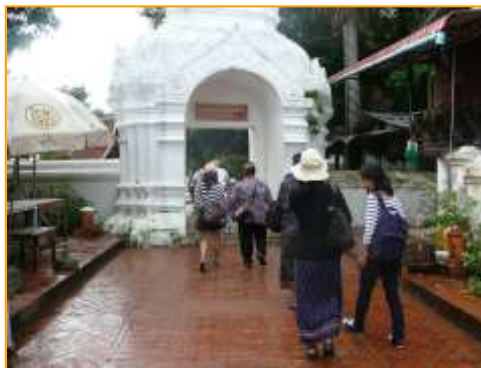
ประตูทางเข้าวัดเชียงทอง

เมื่อรับประทานอาหารกลางวันเสร็จแล้ว ผู้จัดทัวร์และมัคคุเทศก์ท้องถิ่น ก็พาคณะศึกษาดูงานไปชมสถาปัตยกรรม ศิลปกรรม จิตรกรรม และความงดงามของวัดในหลวงพระบาง วัดแรกๆที่ไปชมคือ วัดเชียงทอง