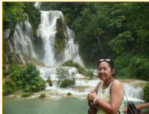
ความสวยงามของน้ำตกกวางสี ชั้นที่ 5

น้ำตกกวางสีเป็นน้ำตกหินปูน สูงราว 70 เมตรมีทั้งหมด 7 ชั้น สภาพป่าร่มรื่น มีสะพานและเส้นทางเดินชมรอบๆ น้ำตก และสามารถเดินเลาะข้างน้ำตกไปชมน้ำตกชั้นบนถัดขึ้นไปได้ นอกจากนี้จะชื่นชมความงามของน้ำตกแล้ว ยังหาซื้อของที่ระลึกบริเวณทางเข้าน้ำตก ซึ่งเป็นสินค้าพื้นเมืองที่ทำจากไม้ไผ่เป็นของใช้หลายชนิด และมีร้านอาหารตามสั่งให้บริการอยู่หลายร้าน