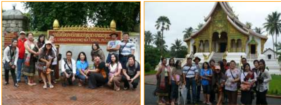
ประตูทางเข้าและด้านหน้าฝั่งขวามือคือ หอพระบางเป็นที่ประดิษฐานพระบาง

เมื่อเดินทางเข้ามาด้านซ้ายมือเป็นโรงละครพระลักพระลาม (หรือที่ประเทศไทยเรียกว่า พระลักษมณ์ พระราม) เปิดทำการแสดงสัปดาห์ละ 3 วัน คือ วันจันทร์ พุธ ศุกร์ และในช่วงไฮล์ซีซั่น จะเปิดวันเสาร์ด้วย ด้านหน้าโรงละครเป็นที่ตั้งของอนุสาวรีย์เจ้ามหาชีวิตศรีสว่างวงศ์