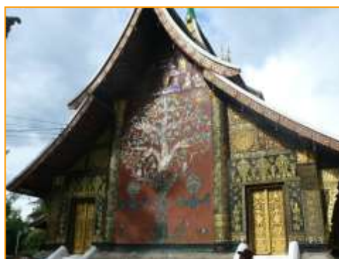
จิตรกรรมฝาผนังจำลองเป็นต้นไม้ทองหรือเป็นต้นไม้แห่งชีวิต

นอกจากวัดเชียงทองจะมีพระอุโบสถที่โดดเด่นด้วยสถาปัตยกรรมแบบล้านนาผสมล้านช้างแล้ว การตกแต่งลวดลายตามผนังภายในก็สวยงามไม่แพ้กัน เช่น บริเวณผนังด้านหลังของพระอุโบสถก็มีการตกแต่งด้วยการนำกระจกสีมาตัดต่อกันจำลองเป็นต้นไม้ทองหรือเป็นต้นไม้แห่งชีวิต