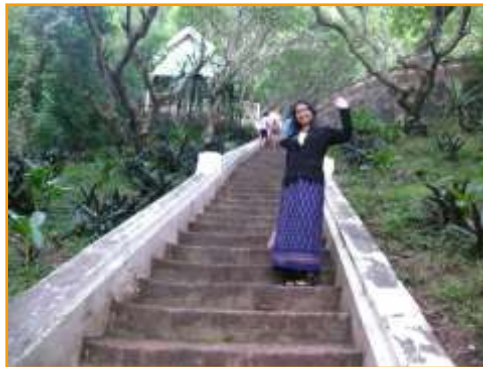
บันไดทางขึ้นไปนมัสการพระธาตุพูสี

การได้เดินขึ้นไปบนยอดพูสีทำให้เห็นเมืองหลวงพระบางได้โดยรอบ และเห็นสายน้ำโขง มีบันไดขึ้นจำนวน 328 ขั้นทางทิศตะวันตกเฉียงเหนือตรงข้ามพระราชวังหลวง ตลอดทางขึ้นร่มรื่นไปด้วยต้นจำปา (ดอกไม้ประจำชาติลาว) หรือที่บ้านเราเรียกว่า ต้นลั่นทม หรือชื่อที่ตั้งใหม่ว่า ราชวดี นั่นเอง