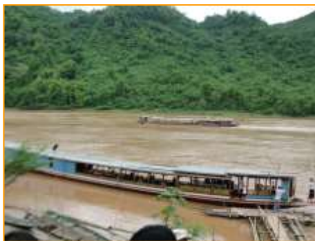
ท่าเรือบ้านช่างไห

หลังจากขึ้นเรือที่บ้านช่างไหแล้ว ก็ล่องเรือทวนกระแสน้ำโขงไปถ้ำตั้ง บรรยากาศสองฝั่งแม่น้ำยังอุดมสมบูรณ์เขียวขจีไปด้วยป่าไม้