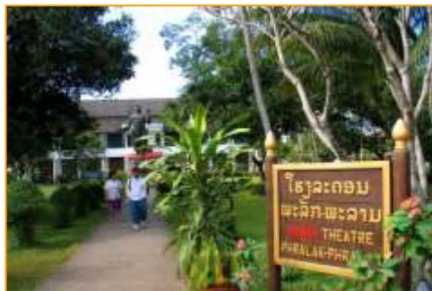
โรงละครพระลักพระลาม และอนุสาวรีย์เจ้ามหาชีวิตศรีสว่างวงศ์

ส่วนทางด้านขวาของประตูทางเข้า คือ หอพระบาง สร้างสำหรับเป็นที่ประดิษฐาน พระบาง ซึ่งเป็นพระพุทธรูปศักดิ์สิทธิ์ของลาว องค์พระสูง 83 เซนติเมตร พระหัตถ์แสดงปางอภัยมุทรา หล่อขึ้นด้วยทองคำ บริสุทธิ์เกือบทั้งองค์ รวมน้ำหนักทั้งสิ้นราว 43 ถึง 54 กิโลกรัม ตามตำนานเล่าว่า พระพุทธรูปองค์