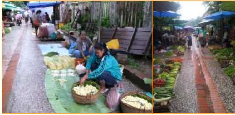
บรรยากาศตลาดเช้าของหลวงพระบาง

ในทัศนะของผู้เขียน มีมุมมองการใช้ชีวิตที่เรียบง่ายอยู่กับธรรมชาติว่า เป็นสิ่งที่คนไทยทุกคนจะตระหนัก เนื่องจากวิถีชีวิตของคนไทยทุกวันนี้ โดยเฉพาะคนเมืองมีการแข่งขันกันสูง ชีวิตเต็มไปด้วยความเคร่งเครียดทั้งการทำงาน การดำเนินชีวิต และการอยู่กับเทคโนโลยีสมัยใหม่ไม่ต้องพึ่งพาธรรมชาติ หากต้องการสิ่งใดก็จะไปที่ห้างสรรพสินค้า หรือ เซเว่น อีเลฟเว่น ฯลฯ ไม่เหมือนคนชนบท หากต้องการอาหารหรือยารักษาโรคก็จะได้จากป่า ทุ่งนา และ แม่น้ำ เมื่อคนเมืองอยู่กับวัตถุมากเกินไปไม่ค่อยได้สัมผัสธรรมชาติก็จะทำให้จิตใจที่อ่อนโยน ค่อน ๆ แข็งกระด้าง ดังที่ปรากฏตามหน้าหนังสือพิมพ์หรือข่าวในทีวีอยู่เนือง ๆ ถึงพฤติกรรมที่โหดร้าย ดังนั้นเราควรที่มาหวงแหนดูแลรักษาทรัพยากรธรรมชาติที่ยังเหลืออยู่ของเราให้เจริญงอกงามเพิ่มขึ้นไปพร้อม ๆ การทำนุบำรุงรักษาขนบธรรมเนียม ประเพณี ศิลปวัฒนธรรมไทย เพื่อการพัฒนาจิตใจให้อ่อนโยน มีเมตตา กรุณาต่อเพื่อนพ้องน้องพี่ร่วมโลก และใช้ชีวิตที่เรียบง่ายบนพื้นฐานของคำว่า พอเพียง และเพียงพอ ดังพระราชดำรัสของในหลวง หากน้อมนำมาใช้ในการดำเนินชีวิต ความสุขที่แท้จริงคงอยู่ไม่ไกลเกินเอื้อม