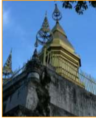
พระธาตุพูสี