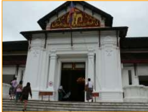
พระราชวังหลวงพระบาง

นี้สร้างขึ้น ที่เกาะสิงหล เมื่อราวศตวรรษ ที่ 1 เจ้าฟ้าจุ่ม ทรงได้รับพระราชทานจากกษัตริย์เขมรมาอีกต่อหนึ่ง แต่ก็ต้องตกไปอยู่ในเมืองสยามถึงสองครั้ง ในปี พ.ศ. 2322 (ค.ศ. 1779) และ พ.ศ. 2370 (ค.ศ. 1827) จน ปี พ.ศ. 2410 (ค.ศ. 1867) พระบาทสมเด็จพระจอมเกล้าฯ จึงทรงโปรดเกล้าฯ พระราชทานกลับคืนไปให้