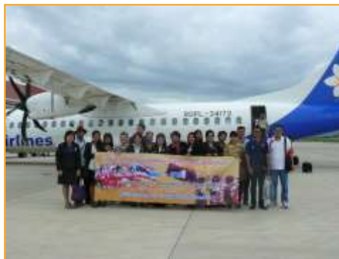
คณะศึกษาดูงานถ่ายรูปกับเครื่องบินสายการบินลาวเป็นที่ระลึก

04.30 น. วันที่ 26 กรกฎาคม 2556 คณะศึกษาดูงานได้ออกเดินทางจากมหาวิทยาลัยฯ ไป สนามบินสุวรรณภูมิ เพื่อขึ้นเครื่องสายการบินลาว เที่ยวบินที่ QV643 เครื่องออกเวลา 10.30 น. แต่ต้อง เข้าเช็คอินก่อนเครื่องออก 2 ชั่วโมง เพื่อปกติใช้เวลาเดินทางประมาณ 2 ชั่วโมง แต่เที่ยวบินนี้เจอสภาพ อากาศแปรปรวนจึงทำให้การเดินทางช้าไปเกือบ 1 ชั่วโมง ทำให้ต้องเปลี่ยนตารางกิจกรรมไปเยี่ยมชม ศึกษาดูงานที่มหาวิทยาลัยสุภานุวงศ์ก่อน