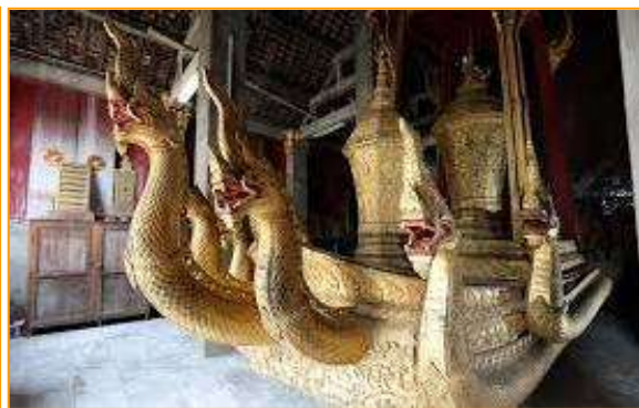
พระราชรถ

พระอุโบสถ หรือที่ชาวลาวเรียกว่า สิม เป็นสถาปัตยกรรมแบบล้านนาผสมกับล้านช้าง สถาปัตยกรรมแบบล้านนา คือ หลังคาพระอุโบสถที่แอ่นโค้งซ้อนกันอยู่ 3 ชั้น ลดหลั่นเกือบจรดฐานจนแลดูค่อนข้างเตี้ย ซึ่งเป็นศิลปะที่อ่อนช้อยเหมือนนกกำลังกางปีก ส่วนกลางของหลังคามีเครื่องยอดสีทอง ซึ่งชาวลาวจะเรียกว่า “ช่อฟ้า” ประกอบด้วย 17 ช่อ อันเป็นสัญลักษณ์ของการสร้างวัดโดยพระเจ้าแผ่นดิน ถ้าช่อฟ้าน้อยกว่า 17 ช่อ หมายถึงการสร้างวัดโดยมหาอุปราช หรือตามฐานะของคนที่สร้าง ส่วนวัดที่คนสามัญสร้างจะมีช่อฟ้าเพียง 1-7 ช่อเท่านั้น