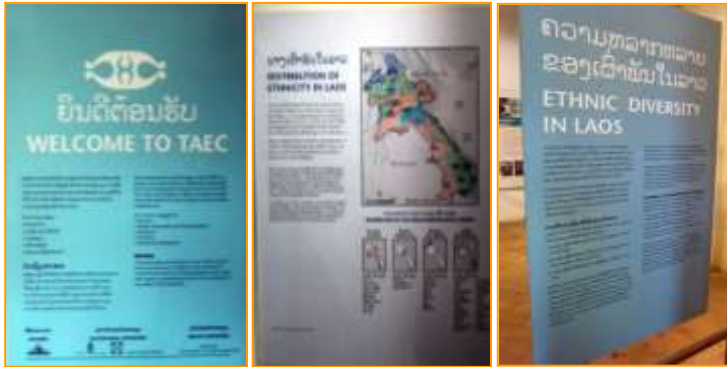
การจัดแสดงนิทรรศการถาวรใน

ความหลากหลายทางวัฒนธรรมไม่ได้เป็นอุปสรรคในการดำเนินงานของคณะผู้จัดศูนย์ศิลปะและชนเผ่าวิทยา เนื่องจากคณะผู้จัดมีใจรักในการดำเนินงานและสามารถระดมทุนในการดำเนินงานได้