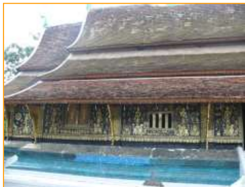
ภายนอกผนังพระอุโบสถลงรักปิดทอง

นอกจากวัดเชียงทองจะมีพระอุโบสถที่โดดเด่นด้วยสถาปัตยกรรมแบบล้านนาผสมล้านช้างแล้ว การตกแต่งลวดลายตามผนังภายในก็สวยงามไม่แพ้กัน เช่น บริเวณผนังด้านหลังของพระอุโบสถก็มีการตกแต่งด้วยการนำกระจกสีมาตัดต่อกันจำลองเป็นต้นไม้ทองหรือเป็นต้นไม้แห่งชีวิต