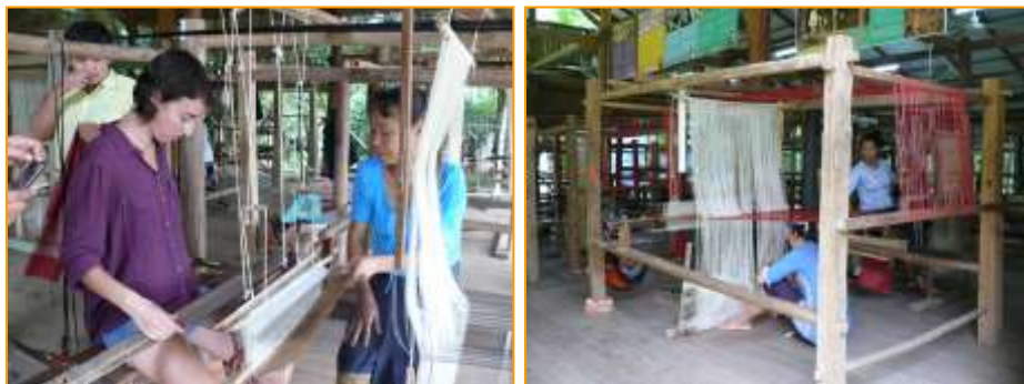
อบรมการทอผ้าให้กับผู้สนใจ และสร้างงาน กระจายรายได้สู่ท้องถิ่น

แนวคิดที่ได้จากศูนย์ทอผ้าแห่งนี้ คือ การจัดการศูนย์ทอผ้าแบบเบ็ดเสร็จ เป็นการนำทรัพยากรที่มีอยู่มาจัดการให้เป็นระบบ แต่มีความเรียบง่าย อนุรักษ์ความเป็นเอกลักษณ์ของท้องถิ่น ปรับประยุกต์ลวดลายและออกแบบผลิตภัณฑ์ให้มีความหลากหลายตรงตามความต้องการของผู้ใช้ และสร้างมูลค่าเพิ่มให้กับสินค้า รวมทั้งจัดวางสิ่งต่างๆเกี่ยวกับภูมิปัญญาการทอผ้าเอาไว้อย่างลงตัว ผู้เขียนคิดว่า สำนักศิลปะและวัฒนธรรมอาจใช้แนวคิดของศูนย์ทอผ้าออกพบตกมากระตุ้นการจัดการกับมรดกทางวัฒนธรรมและภูมิปัญญาของชาวราชบุรีโดยเน้นการมีส่วนร่วมของชุมชน เพื่อให้เกิดการเชื่อมโยงเป็นเครือข่ายการท่องเที่ยวทางวัฒนธรรม รวมถึงประชาสัมพันธ์วัฒนธรรมที่เป็นเอกลักษณ์ ชุมชนให้เป็นที่รู้จักทั้งภายในเครือข่ายและนอกเครือข่าย อีกทั้งกระตุ้นการสร้างและพัฒนาเครือข่ายการท่องเที่ยวทางวัฒนธรรมให้เข้มแข็งเพื่อนำไปสู่การท่องเที่ยวทางวัฒนธรรมอย่างยั่งยืน