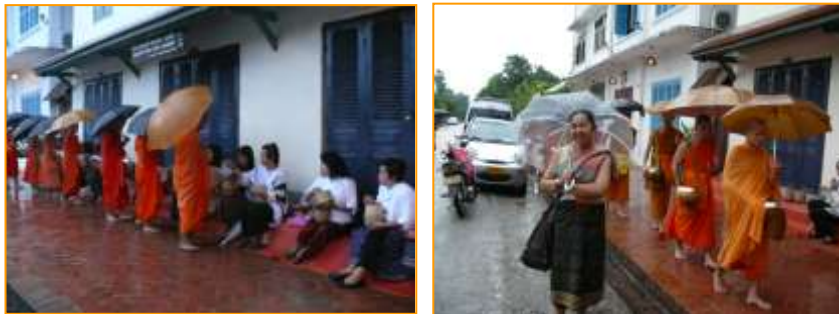
บรรยากาศการร่วมตักบาตรข้าวเหนียว

กรใส่บาตรของชาวหลวงพระบางนั้น จะเปลี่ยนเวลาไปตามฤดูกาล ให้สังเกตจากเสียงกลองของวัด หากมีเสียงย่ำกลองเมื่อใด แสดงว่าพระสงฆ์เตรียมตัวจะออกบิณฑบาตแล้ว ชาวบ้านจะรีบปูเสื่อตรงริมทางที่พระจะเดินผ่าน ผู้หญิงต้องนุ่งซิ่นและมีแพรเบียงหรือผ้าสไบพาดไหล่ไว้เสมอสำหรับเป็นผ้ากราบพระ ส่วนผู้ชายต้องนุ่งกางเกงขายาวและมีผ้าพาดเช่นกัน และเวลาใส่บาตรจะต้องนั่งคุกเข่า