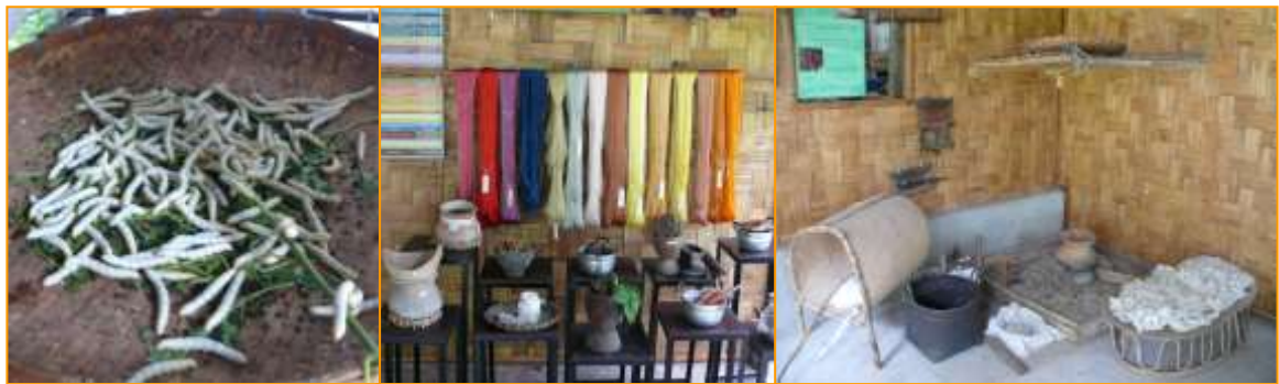
นิทรรศการมีชีวิตแสดงวัสดุ อุปกรณ์ และภูมิปัญญาการทอผ้า

มีคศุเทศก์ได้พาคณะศึกษาดูงานไปเยี่ยมชมศูนย์ทอผ้าออกพบตก แต่ฟังชื่อก็ชวนให้สงสัยแล้วว่าทำไมจึงชื่อนี้ มีคศุเทศก์ให้ข้อมูลว่า เหตุที่ชื่อนี้ก็เพราะเป็นศูนย์ทอผ้าของนักธุรกิจชาวตะวันตกที่มีเพื่อนชาวตะวันออกมาทำธุรกิจร่วมกัน แล้วจัดตั้งศูนย์ทอผ้าแห่งนี้ขึ้นมา สิ่งที่น่าสนใจกับศูนย์ทอผ้าออกพบตก คือ การมีระบบการจัดการรองรับการท่องเที่ยวทางวัฒนธรรมที่ครอบคลุมการอนุรักษ์ และการสืบสานภูมิปัญญาการทอผ้าอย่างยั่งยืน คือ นอกจากจะมีการทอผ้าที่มีการประดิษฐ์ลวดลายและปรับประยุกต์ให้ตรงตามความต้องการของลูกค้า ซึ่งลูกค้าส่วนใหญ่จะเป็นชาวตะวันตกแล้ว ยังมีการจัดนิทรรศการสาธิตวิธีการขั้นตอนการเลี้ยงไหม วัตถุประสงค์การย้อมสีธรรมชาติ จัดคอร์สฝึกอบรมการทำเครื่องจักสาน การทอผ้า จัดนิทรรศการแสดงอุปกรณ์และวิถีชีวิตการทอผ้า เป็นต้น