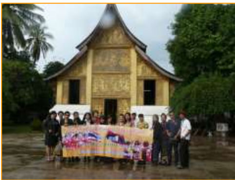
ลักษณะภายนอกโรงเมี้ยนโกศ

ปิดทองคำเปลวรอบคัน มีพระโกศ 3 องค์ ตรงกลางเป็นโกศองค์ใหญ่ของเจ้าศรีสว่างวัฒนา องค์เล็กด้านหลังเป็นของพระราชมารดา ส่วนองค์เล็กด้านหน้าเป็นของพระเจ้าอา โรงเมี้ยนโกศนี้ออกแบบโดยเจ้ามณีวงศ์ และแกะสลักโดยช่างหลวงพระบางที่ชื่อ “เพี้ยตัน” เมื่อครั้งที่รับราชการอยู่ในพระมหาราชวัง นับเป็นช่างฝีมือชั้นเอกประจำพระองค์ของเจ้ามหาชีวิตศรีสว่างวัฒนา มีความชำนาญทั้งด้านงานเขียนและงานแกะสลัก จุดเด่นอีกอย่างหนึ่งของโรงเมี้ยนโกศ คือบริเวณผนังด้านนอกที่ช่างหลวงเพี้ยตันแกะสลักไว้อย่างงดงามลงด้วยสีทองสุก เล่าเรื่องราวมเกียรติ์ตอนสำคัญ ๆ เช่น ด้านบนสุดเป็นตอนพิเภกกำลังบอกความลับเรื่องที่ซ่อนหัวใจของทศกัณฐ์กับพระราม พระลักษมณ์และนางสีดา ถัดลงมาเป็นตอนที่ทศกัณฐ์ต้องศรของพระรามเสียบเข้าที่หัวใจ เป็นต้น เดิมทีภาพแกะสลักเหล่านี้เป็นลักษณะการลงรักปิดทองที่สวยงามต่อมาได้มีการบูรณะใหม่ โดยทาสีทองทับลงไปดังที่เห็นในปัจจุบัน นอกจากนี้ภายในวัดเชียงทองยังมีเขตสังฆาวาส ประกอบด้วยกุฏิสฎูปเจดีย์ ดังเช่นวัดทั่วๆ ไปและยังมีพระสงฆ์จำพรรษาอยู่