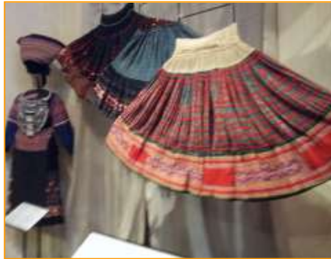
การจัดแสดงชุดการแต่งกายในงานปีใหม่ของผู้หญิงชาติพันธุ์ม้ง

กลุ่มชาติพันธุ์ม้ง : ม้งเป็นกลุ่มชาติพันธุ์ที่มีอัตลักษณ์ในเรื่องการปักผ้า การแต่งกายของชาวม้งมีความสวยงาม การปักผ้าและปะผ้ามีลายเส้นที่ใช้เส้นด้ายสีส้ม, แดง, ม่วง และน้ำเงิน