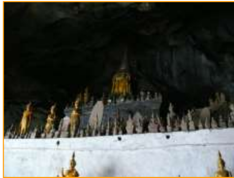
บรรยากาศภายนอกและภายในถ้ำดิ่ง

การเดินทางมานมัสการพระที่ถ้ำดิ่ง คณะศึกษาดูงานได้เห็นถึงร่องรอยความเจริญรุ่งเรืองของพระพุทธศาสนาและความเลื่อมใสศรัทธาของพุทธศาสนิกชนชาวหลวงพระบาง ตลอดจนได้สัมผัสวิถีชีวิตที่เรียบง่ายของชาวหลวงพระบางสองฝั่งแม่น้ำโขง และได้สูดอากาศบริสุทธิ์เพิ่มพลังชีวิต