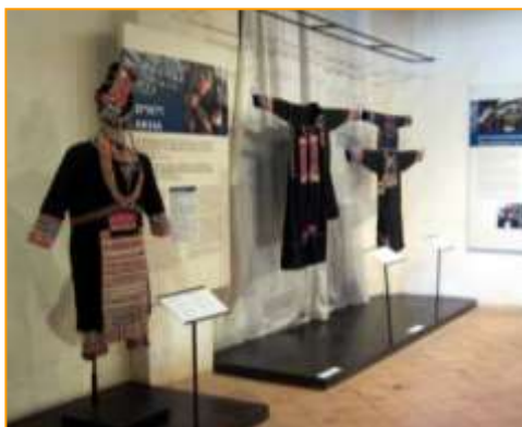
การจัดแสดงชุดแต่งงานของกลุ่มชาติพันธุ์อาข่าภายในศูนย์ศิลปะและชนเผ่าวิทยา

กลุ่มชาติพันธุ์อาข่า: ความหลากหลายของกลุ่มชาติพันธุ์อาข่าแสดงให้เห็นถึงความแตกต่างระหว่างกลุ่มย่อยของชาวอาข่าที่มีผ้าโพกศีรษะที่สวยงามและมีเครื่องประดับที่ทำจากทั้งเงินและโลหะมากกว่า 300 ชิ้นของอาข่าที่อาศัยในดินแดนอินโดจีน