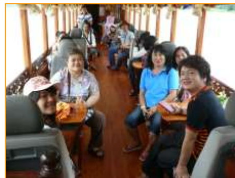
บรรยากาศการล่องเรือ

การล่องเรือชมทิวทัศน์อยู่กลางแม่น้ำโขง สภาพอากาศวันนั้นค่อนข้างเย็นสบาย มีแดดรำไร มีสายฝนโปรยปรายเบาๆ คณะศึกษาดูงานใช้เวลาล่องเรือประมาณครึ่งชั่วโมงก็มาถึงถ้ำตั้ง มัคคุเทศก์ให้ข้อมูลว่า ถ้ำตั้งเป็นสถานที่ศักดิ์สิทธิ์ เมื่อประมาณ 400 กว่าปีที่แล้ว ชาวลาวแถบนี้นับถือผีนางงาไม้ ในรัชสมัยพระเจ้าไชยเชษฐาธิราชที่พุทธศาสนาเจริญรุ่งเรืองมากที่สุด พระองค์ได้นำพระพุทธรูปมาประดิษฐานที่ถ้ำตั้งเพื่อให้ประชาชนชาวลาวที่นับถือผีหันมากราบไหว้บูชาพระแทน และพระองค์ทรงสร้างพระเจดีย์จำลองพระบรมธาตุเกตแก้วจุฬามณีบรรจพระบรมสารีริกธาตุของพระสัมมาสัมพุทธเจ้าประดิษฐานไว้ที่ถ้ำตั้งเพื่อให้พุทธศาสนิกชนได้กราบไหว้ สมัยก่อนเจ้ามหาชีวิตก็จะเสด็จมาที่ถ้ำตั้งเพื่อประกอบพิธีทางศาสนาในช่วงเทศกาลปีใหม่ และวันสงกรานต์ ปัจจุบันถึงแม้ไม่มีเจ้ามหาชีวิตแล้วชาวบ้านก็ยังถือเป็นประเพณีปฏิบัติกันอยู่ ภายในถ้ำตั้งจะมีพระพุทธรูปจำนวนมากที่ชาวหลวงนำมาประดิษฐาน มีทั้งพระพุทธรูปที่ทำมาจากดิน ปูน ส้มฤทธิ์ ไม้ ฯลฯ