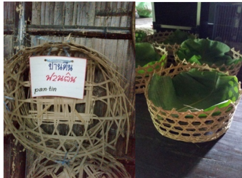
ปานติน

ปานติน คือ ภาชนะจักสานที่ใช้ใส่ของเช่นไห้วในพิธีเสนของชาวไทยทรงดำ