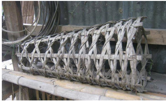
กระทอโตหุม

กระทอโตหุม คือ ภาชนะจักสานใช้ใส่หุมเพื่อเคลื่อนย้ายหรือส่งโรงฆ่า