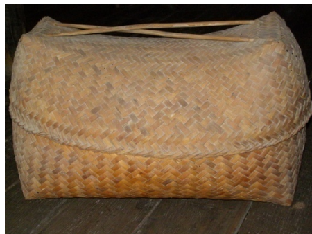
ขมุกของชาวไทยทรงดำใช้เก็บเสื้อผ้าเครื่องนุ่งห่ม

ขมุก คือ ภาชนะไม้สานเป็นลายสามเหลี่ยมผืนผ้า มีฝาปิดขนาด 75 ซม. กว้าง 35 ซม. สูงประมาณ 40 ซม. ประโยชน์ใช้สอยคือ สำหรับเก็บผ้าที่ทอเสร็จแล้ว จะเป็นผ้าผืนหรือเป็นผ้าส่วนตัว ขมุกเก็บไว้บนเพดานบ้านโดยไม้ไผ่พาดช้อนบ้าน