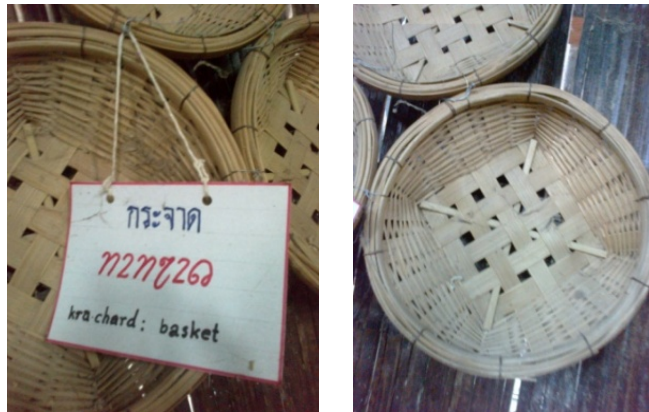
กระจาด

กระจาด คือ ภาชนะจักสาน รูปเตี้ยๆ ปากกว้าง ก้นสอบ ใช้ใส่ของ