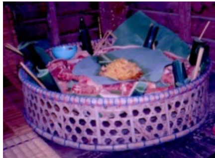
ปานเดือน

ปานเดือน เป็นภาชนะที่ใส่เครื่องเช่นผีเรือนเทวดา ในพิธีเสนเฮือน, เสนโต้, เสนฆ่าเกียด เป็นต้น