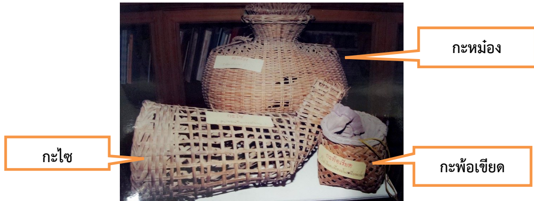
กะหม่อม กะไซ และกะพ้อเขียด

กะพ้อเขียด คือ ภาชนะจักสานที่ใช้ในการใส่เขียดเพื่อเป็นเหยื่อล่อปลา