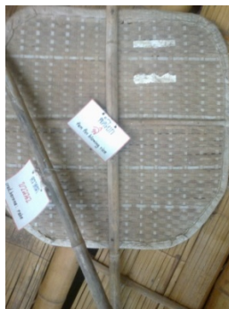
ของใช้ในชีวิตประจำวัน ประเภทจักสาน: พัดโบก

พัดโบก คือ งานจักสานที่ชาวไทยทรงดำทำขึ้นเพื่อช่วยในการพัดโบกให้เย็นสบาย ไล่แมลง หรือพัดโบกเพื่อหุงต้มให้ไฟติดไว