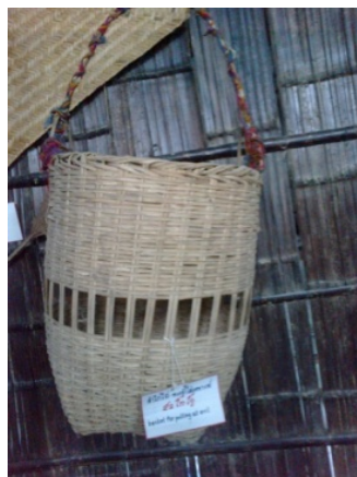
ส้าไก่ได้

ส้าไก่ได้ คือ ตะกร้าใส่แคราะห์ที่หมอเสนาใช้ประกอบพิธีเสนเฮื่อน