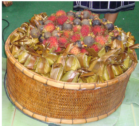
ปานขวัญ

ปานขวัญ เป็นภาชนะใช้ใส่เครื่องเซ่นไหว้สิ่งศักดิ์สิทธิ์ในพิธีแปงขวัญหรือเรียกขวัญ