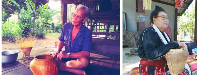
กะเหล็บ

นอกจากนั้น ชายหนุ่มชาวไทยทรงดำก่อนแต่งงานจะต้องสานกะเหล็บเป็นเครื่องใช้ชิ้นหนึ่งที่เจ้าสาวต้องใช้สะพายบ่าตอนเข้าพิธีแต่งงาน เป็นการอวดหญิงว่าตนเองนั้นเป็นผู้ที่มีความสามารถเหมาะสมที่จะเป็นหัวหน้าครอบครัว