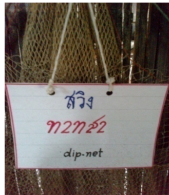
สวิง

สวิง คือ อุปกรณ์จับสัตว์น้ำจืดโดยเฉพาะปลาเล็กปลาน้อย กุ้งฝอย เป็นต้น