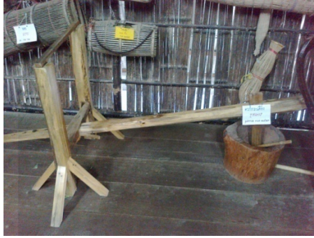
ครกกระเดื่อง

ไผ่หนึ่ง คือ ภาชนะสำหรับนึ่งข้าวเหนียว ทำด้วยไม้ต้นนุ่นหรือต้นทองหลาง ชูตให้กลวงปากกลม ทรงกระบอกตรงกลางป่อง สูง 1 ฟุต ก้นไผ่กรุด้วยไม้ไผ่สาน เป็นตารางพอให้ออน้ำขึ้นผ่านได้ เวลานึ่งน้ำไผ่หนึ่งไปตั้งบนหม้อน้ำเดือด มีฝาปิดด้านบนของไผ่หนึ่ง การใส่ข้าวเหนียวลงไปนึ่งไผ่หนึ่งจะต้องล้างให้สะอาด แล้วห่อด้วยผ้าขาวบางเพื่อไม่ให้ข้าวเหนียวติดผนังของหม้อไผ่หนึ่ง