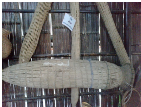
ช้อน