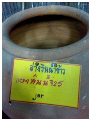
อ่างรินน้ำข้าว

อ่างรินน้ำข้าว คือ ภาชนะดินเผาที่ใช้เก็บน้ำที่นำมาใช้ในการหุงข้าว ตั้งไว้ในครัว