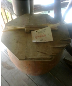
โองน้ำต้ม

โองน้ำต้ม คือ ภาชนะดินเผาที่ชาวไทยทรงดำใช้ใส่น้ำฝนเพื่อต้มกิน