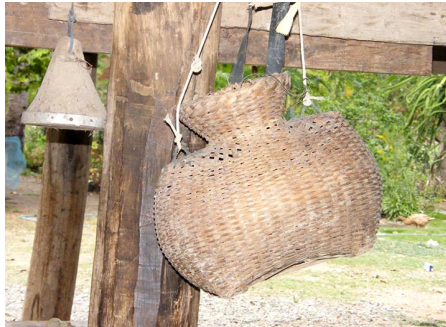
กะหมวง หรือ หมวง

กะหมวง หรือ หมวง ภาชนะจักสานไว้ใส่ปลาที่จับในท้องนา