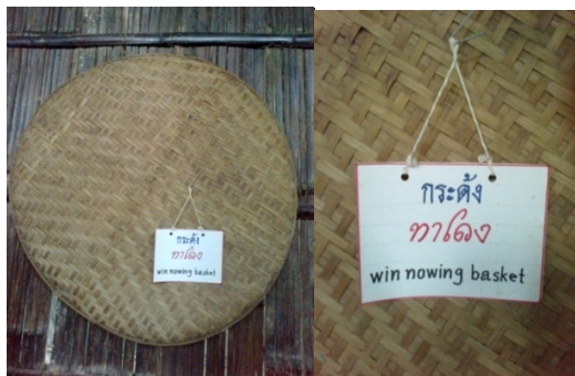
กระดั่ง

กระดั่ง คือ ภาชนะใช้สำหรับผัดข้าวเพื่อแยกเอาเศษผงฝุ่น แกลบ ออกจากเมล็ดข้าว หรือเมล็ดพันธุ์ชนิดอื่นที่มีเปลือก ซึ่งเป็นการคัดแยกกระหว่างข้าว หรือเมล็ด และเปลือกออกจากกัน โดยชาวไทยทรงดำที่ประกอบอาชีพทำนาจะนำข้าวที่ตำแล้ว วางใส่ไว้ในกระดั่งและทำการผัดโดยใช้มือทั้งสองข้างจับขอบปากกระดั่ง แล้วทำการร่อน โดยให้กระดั่งขึ้นลงเพื่อพัดเศษหรือเปลือกข้าวก็จะปลิวตามแรงลม เนื่องจากน้ำหนักเบามาก จะได้เมล็ดที่มีน้ำหนักหล่นที่กระดั่ง