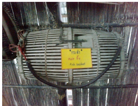
กระชัง

กระชัง คือ ภาชนะจักสานด้วยไม้ไผ่ มีปากเปิดกว้างคล้ายๆ ตะกร้าหรือเข่งใส่ของ แต่ใหญ่กว่า ใช้จับปลาขนาดใหญ่