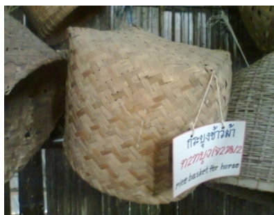
กระบุงข้าวม้า

กระบุงข้าวม้า คือ ภาชนะจักสาน ส่วนใหญ่สานด้วยไม้ไผ่ ใช้สำหรับใส่ข้าวเปลือก ข้าวสาร