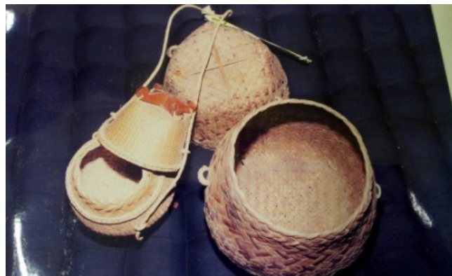
แอบข้าว

แอบข้าว คือ ภาชนะที่สานด้วยไม้ไผ่รูปทรงเหมือนตุ่มคอสูง มีฝาสวมครอบ มีฐานสี่เหลี่ยม มีสายสะพายสานแบบลายฟองดีหล่ม ใช้สำหรับใส่ข้าวเหนียวที่นึ่งแล้ว ไว้สำหรับใส่อาหารหิวไปรับประทาน เวลาออกไปทำนา แอบข้าวบางแบบทำด้วยไม้ทองเหลืองหรือไม้ต้นนุ่น ขุดถากให้เป็นรูปคล้ายตุ่ม แต่มีฝาครอบ เรียกว่า “ก่องข้าว”