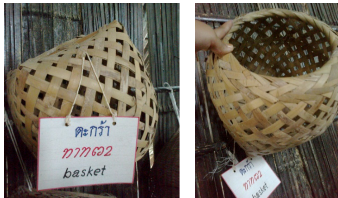
ตะกร้า

ตะกร้า คือ ภาชนะจักสานทรงกลมโปร่งสำหรับใส่สิ่งของ