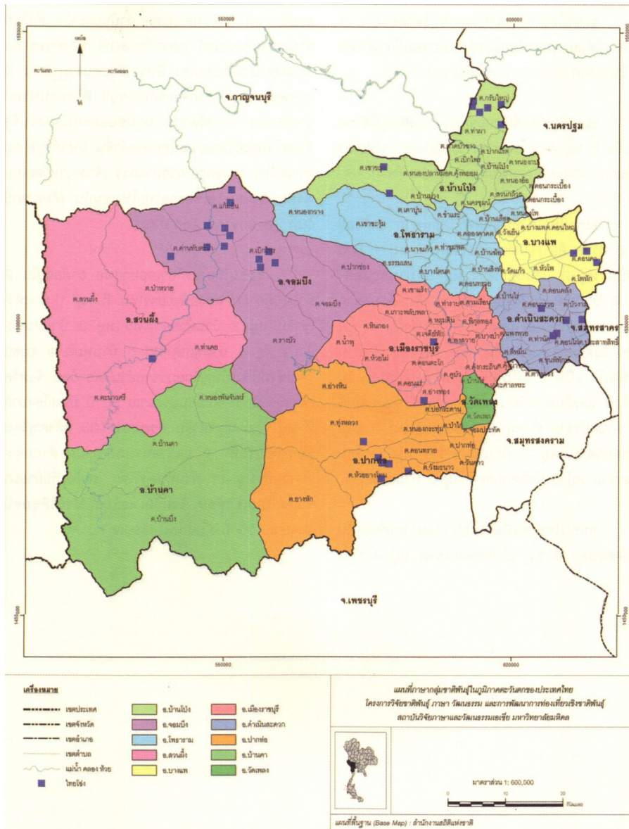
แผนที่ 1: แสดงบริเวณที่มีการใช้ภาษาไทยทรงดำในจังหวัดราชบุรี

สถาบันวิจัยภาษาและวัฒนธรรมเอเชีย มหาวิทยาลัยมหิดล ได้สร้างแผนที่ภาษากลุ่มชาติพันธุ์ในประเทศไทยขึ้นมาเพื่อแสดงพื้นที่การใช้ภาษาของกลุ่มคนกลุ่มต่างๆ โดยพื้นที่การใช้ภาษาไทยทรงดำในประเทศไทยนั้นครอบคลุมอาณาบริเวณหลายจังหวัด ทว่าได้หยิบยกการใช้ภาษาไทยทรงดำเฉพาะพื้นที่จังหวัดราชบุรีเท่านั้น เนื่องจากฐานข้อมูลชาติพันธุ์ที่ทางสำนักศิลปะและวัฒนธรรมได้รวบรวมมีพื้นที่ศึกษา คือ จังหวัดราชบุรี