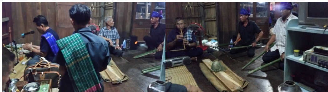
ช่วงกลางคืน พ่อหมอ 4 คน ยังคงทำพิธีสวด ร่ายมนตร์ เสียงทายเม็ดข้าวสาร และเป่าปี่ขับพร้อมกับที่ เพศฆาตเคาะไม้ไผ่เพื่อทำให้แม่เกิดที่สิงอยู่ในร่างของนกที่อยู่ในกรงเคลิ้ม (ที่มาของภาพ: อมรรัตน์ หรสิทธิ์ ถ่ายเมื่อ 31 พฤษภาคม 2557)