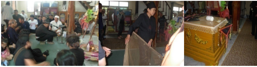
การเรียกขวัญของผู้ตายและเรียกผีขึ้นเรือนก่อนนำร่างไปเผาที่วัด

ขั้นที่สอง สร้างแหว หรือ เรียกว่า เฮ็ดแหว ส่วนประกอบของแหว ถูกเตรียมไว้ที่บ้านแล้วนำมา ประกอบเป็นประกอบส่วนต่างๆ ณ ที่ตรงเนินดินเผาศพนั้น