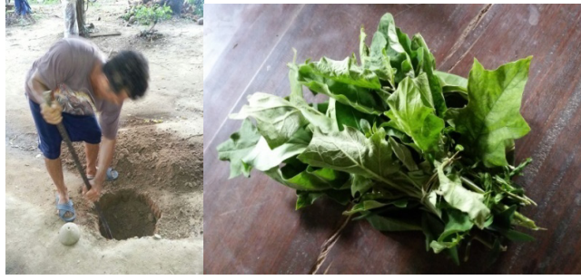
ภาพซ้าย ญาติของเด็กที่ได้รับการทำพิธีเสนาฆ่าเลือดชุดหลุมเตรียมที่จะฝังแม่เกิด ภาพขวา ใบมะเขือใช้ปิดปากหลุมหลังจากเพศฆาตได้ฆ่าแม่เกิด ชาวไทยทรงดำเชื่อว่าใบมะเขือใช้ป้องกัน วิญญาณ