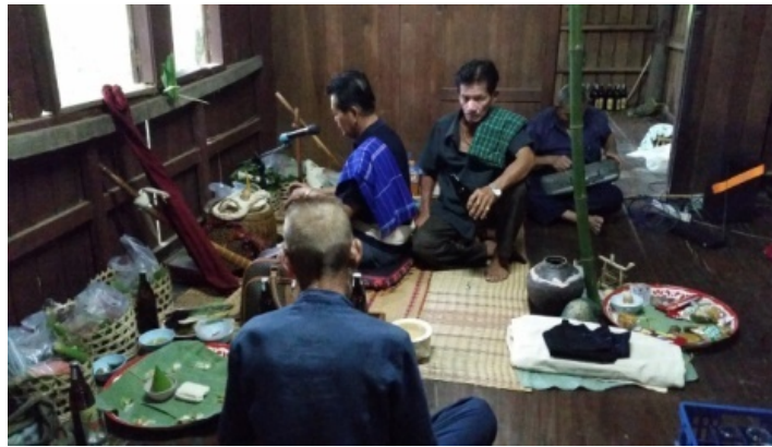
ช่วงบ่ายสามโมง-ก่อนเที่ยงคืน หมอเรียกขวัญ หมอเยื้อง และหมอเป่าจะทำพิธีรำมนตร์พร้อมกับสวด อ้อนวอนแม่เกิดและขับเพลิงปีให้แม่เกิดออกมาจากการสิงร่างของเด็ก