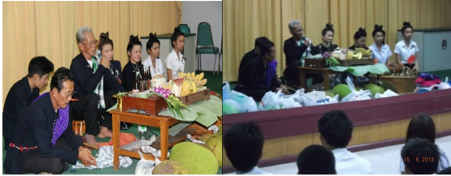
พิธีแปงขวัญเรียกขวัญของไทยทรงดำ ที่มาจัดให้กับนักศึกษามหาวิทยาลัยราชภัฏหมู่บ้านจอมบึง เมื่อเดือนมิถุนายน 2556