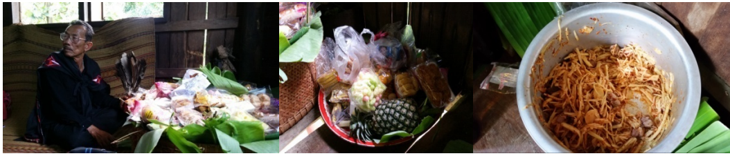
แกงหน่อไม้ (แกงหน่อส้ม) ผลไม้ และขนมอย่างละ 7 อย่าง