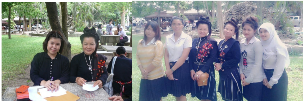
หญิงไทยทรงดำได้เผยแพร่วัฒนธรรมการแต่งกายและพิธีกรรมให้กับนักศึกษามหาวิทยาลัยราชภัฏ หมู่บ้านจอมบึง