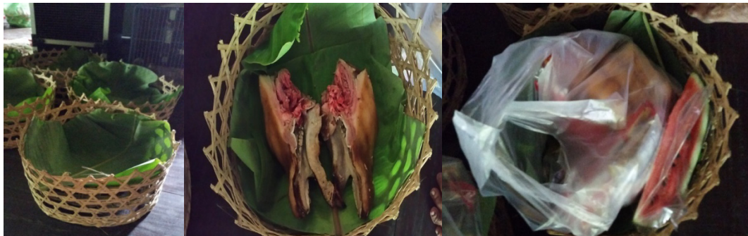
“ปานติน” จำนวน 6 อัน ไว้ใส่เครื่องเซ่นไหว้ในพิธีเส่นฆ่าเกิด เช่น คางหมู, ผลไม้ เป็นต้น (ที่มาของภาพ: อมรรัตน์ หรสิทธิ์ ถ่ายเมื่อ 31 พฤษภาคม 2557)

- เรียกอ้อนแม่เกิดให้มากินอาหารที่เตรียมไว้ โดยมีอาหารที่เตรียมไว้ 2 ลักษณะ ลักษณะแรกเป็นอาหารที่ใส่ในภาชนะสานที่เรียกว่า “ปานติน” มีจำนวน 6 อัน และในปานตินแต่ละอันจะใส่เครื่องเซ่นที่เป็นทั้งของคาวของหวาน และผลไม้ เช่น ไก่ต้ม คางหมู ขนมห และผลไม้ อาหารเซ่นไหว้ลักษณะที่สอง คือ “ปานข้าวตัก หมากข้าวแตง” ซึ่งถือเป็นเครื่องเซ่นไหว้สัตว์ที่เป็นยานพาหนะสำหรับเทพหรือบรรพบุรุษที่ลงมาช่วยในพิธีเส่นฆ่าเกิด เช่น ม้า นก เป็นต้น