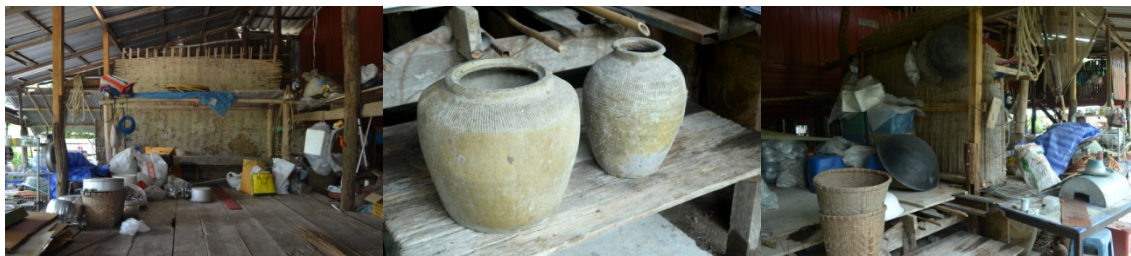
ครัวเรือนของบ้านป่าไผ่ พวกยะ บ้านดอนคลัง อำเภอดำเนินสะดวก จังหวัดราชบุรี