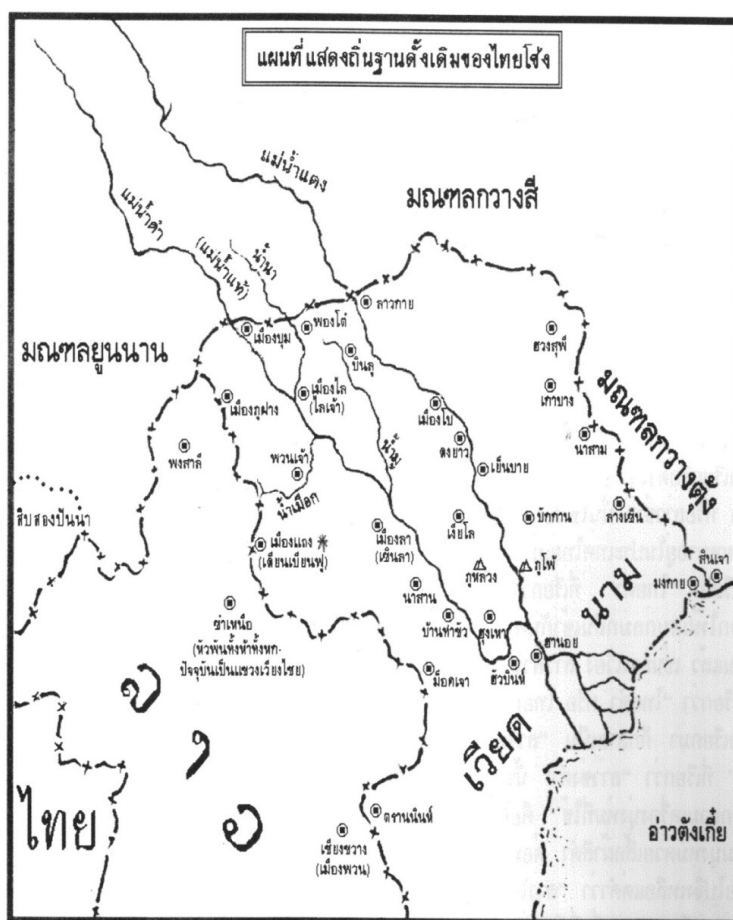
แผนที่ 1 : ถิ่นฐานเดิมของไทยทรงดำ (ที่มา: ม.ศรีบุษรา 2530: หน้า12, อ้างถึงใน สมทรง บุรุษพัฒน์. (2539). สารานุกรมกลุ่มชาติพันธุ์: ไทยโซ้ง กรุงเทพมหานคร : โรงพิมพ์สหธรรม, 2539.

เดียนเบียนฟู (เมืองแดง) เมืองป้อมของฝรั่งเศส ซึ่งเป็นบริเวณที่มีไทดำอาศัยอยู่หนาแน่น จนกระทั่งเดียนเบียนฟูแตก และฝรั่งเศสยอมจำนน จากการสู้รบนี้ทำให้ชาวไทดำประมาณ 2,000 คนอพยพเข้าไปตั้งบ้านเรือนอยู่แถบเมืองหลวงพระบาง และอีกกลุ่มหนึ่งประมาณ 3,000 คนอพยพเข้าไปอยู่ที่เชียงขวาง สถานที่ทำมาหากินค้ำแคบ ไทดำส่วนหนึ่งจึงอพยพมาอยู่ที่แขวงเวียงจันทน์ ที่บ้านอีโล ห่างจากเวียงจันทน์ไปทางเหนือประมาณ 20 กิโลเมตร ไทดำอาศัยอยู่ที่เวียงจันทน์ประมาณ 20 กว่าปี จนกระทั่งคอมมิวนิสต์เข้าครองลาว ชาวไทดำผู้รักอิสระเสรีจำนวนกว่า 2,000 คน ต้องอพยพหลบภัยเข้ามาในประเทศไทย เมื่อ พ.ศ.2518 ในจำนวนนี้ส่วนหนึ่งอยู่ในศูนย์ผู้อพยพ ส่วนหนึ่งกลับไปอยู่ลาว อีกส่วนหนึ่งขอลี้ภัยคอมมิวนิสต์ไปอยู่ที่ประเทศฝรั่งเศส อเมริกา แคนาดา ออสเตรเลีย