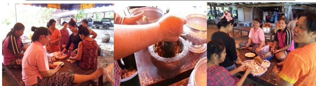
เมื่อวันที่ 13 พฤษภาคม 2557 สำนักศิลปวัฒนธรรมได้สำรวจข้อมูลกลุ่มชาติพันธุ์ไทยทรงดำที่บ้านพื้วัฒนาและพื้พล สุขอยู่, ลุงพัน สุขอยู่และพื้ศรีไพร นันทกิจ บ้านบ้านหัวเขาเงิน ตำบลห้วยยางโทน อำเภอบางท้อ จังหวัดราชบุรี