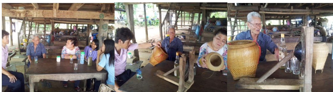
สำนักศิลปะและวัฒนธรรมได้สอบถามรายละเอียดวิถีชีวิตชาวไทยทรงดำที่บ้านลุงพัน สุขอยู่