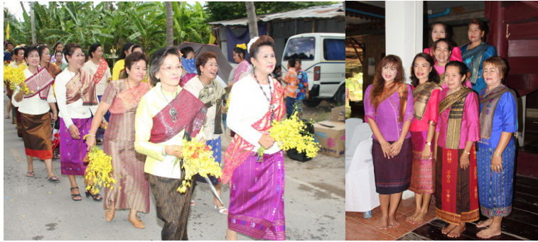
การแต่งกายของหญิงลาวเวียง ราชบุรี ในงานประเพณีของชุมชน

ถ้าอายุต่ำกว่า ๕๐ ปีลงมา ยังใช้ผ้าแพรวพันรอบอกทับลงไปแล้วเหน็บชายผ้าให้แน่นไว้ใต้รักแร้ ปลายชายยาวลงมาถึงสะโพก อันนี้คล้ายคนไทยโบราณ ไม่มีการสวมรองเท้าแต่อย่างใด ฝ่ายหญิงสาว จะสวมเสื้ออ้อดสองสาย รัตกุมและมิดชิดกว่าสายเดี่ยวคออีกแคบลง ตัดกระดุมข้าง หรือหลังเหมือนคนแก่ เวลาไปงานบุญก็ห่มผ้าแพรวทับอีกที ปล่อยชายลงหน้าหลัง พันห่ออกและไหล่หนึ่งรอบ แล้วปล่อยชายลงหน้าหลัง ฟ้านุ่งผ้าถุงก็อาจเป็นสีแก่ สีหมากสุก สีน้ำเงินอมเทาหม่นๆคล้ายโซ่ง แต่ไม่เหมือนส่วนใหญ่ออกมาทางม่วงแดง มีลายทางมาตามยาวบนลงล่าง เป็นริ้วขาวๆเล็กถี่กว่าของโซ่ง ชายผ้าถุงด้านบนมีขอบขาว ด้านล่างชายผ้าถุงมีขอบขาว ประมาณคืบเศษ เวลาสวมใส่คาดเข็มขัดรัดแน่น พันพกผ้าซ่อนชายไว้สนิท เพราะสวมเสื้ออ้อดชายเสื้อจะไม่ยัดลงทับด้วยผ้าถุง เสื้ออ้อดจะลอยอยู่ ชายพกผ้าจะมัดแน่นอยู่ต่างหาก ถ้าสวมเสื้อแขนกระบอกเสื้อก็ปล่อยชายอีกเหมือนกัน จึงต้องนุ่งผ้าถุงให้แน่นเข้าไว้ เวลางานบุญก็ห่มผ้าแพรว สวมเสื้ออ้อดรัดรูป นุ่งผ้าถุงลายทาง กล้าผม ทัดดอก มณฑา พกผ้าสีแดงเซ็ดปากเวลากินหมาก ไม่สวมรองเท้าเช่นกัน สมัยก่อนไม่มีรองเท้าและไม่นิยม หากเป็นคนธรรมดาทั่วไป ก็สวมเสื้อแขนกระบอกรัดรูป นุ่งผ้าถุงสีเข้ม ไม่มีพิธีรีตองมาก ผ้าแพรวสีขาวพาดบ่าสักผืนหนึ่งก็เพียงพอแล้ว ส่วนเด็กไม่ค่อยได้สวมใส่อะไรมากนักหรือแล้วแต่พ่อแม่จะหาให้มีผมแกละ ผมจุก ถักเปีย เหมือนคนไทยทั่วไป