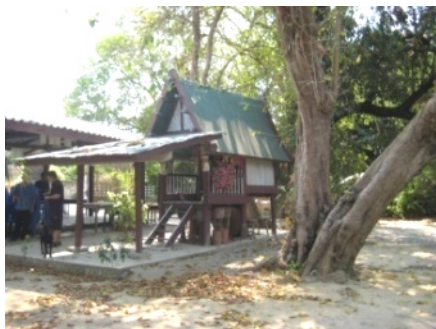
ศาลปู่ตา เจ้านาย

๑. ศาลปู่ตา ตั้งอยู่กลางชุมชนบ้านขนุนหมู่ที่ ๓ เพื่อปกป้องคุ้มครองภัยอันตรายทั้งปวงให้ลูกหลานอยู่เย็นเป็นสุข และเป็นที่ยึดเหนี่ยวทางจิตใจ ๒. ศาลเจ้านาย หรือ ศาลเจ้าปู่ทุ่ง ตั้งอยู่ชายทุ่งหนองแซ่ หมู่ที่ ๔ เพื่อปกป้องคุ้มครองไร่ นา สัตว์เลี้ยง และการทำมาหากินของลูกหลานให้พ้นจากภัยพิบัติทางธรรมชาติ