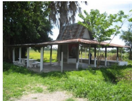
ศาลปู่ทุ่ง ศาลเจ้านาย

จึงน่าจะเชื่อได้ว่าชุมชนบ้านขนุนหมู่ที่ ๓ เป็นจุดแรกที่ลาวเวียง จันทน์อพยพมาตั้งถิ่นฐานของลาวเวียงตำบลบ้านเลื่อม (จุดรวมกันพักพิงชั่วคราว) จุดนี้เรียกว่า บ้านใหญ่ ก่อนที่จะไปจับจองที่ดินปลูกสร้างบ้านเรือนอยู่อาศัยของแต่ละครอบครัว กลุ่มที่ปลูกสร้างบ้านอยู่ใกล้วัดบ้านเลื่อมเรียกว่า บ้านเลื่อมใต้ หรือบ้านใต้ (หมู่ที่ ๔) กลุ่มถัดบ้านเลื่อมใต้ไปทางทิศเหนือ เรียกว่า บ้านเตาเหล็ก(หมู่ที่ ๕) กลุ่มที่อยู่ใกล้วัดเหนือ (ปัจจุบันวัดโบสถ์)