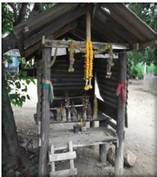
บ้านต้นโพธิ์

สิ่งที่น่าประทับใจในคติความเชื่อของชาวกะเหรี่ยงเกี่ยวกับหงส์ คือ เรื่องความรัก ความผูกพัน ความอาลัย ที่มีต่อผืนแผ่นดินเดิมของตน จากคำบอกเล่าของชาวไทยกะเหรี่ยงว่า หงส์ที่อยู่บนยอดเสาทุกหมู่บ้านจะหันหน้าไปทางทิศเหนือ แล้วมุ่งหน้าสู่ดินแดนทางใต้ ซึ่งหมายถึง ถิ่นฐานที่เดินทางจากมา การระลึกถึงแผ่นดินเกิดคงมีแต่ผองชนที่มีอารยธรรมดงามสูงส่งเท่านั้น เช่นเดียวกับความเชื่อเรื่องหงส์ของชาวมอญ