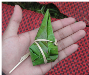
ข้าวห่อตัวผู้

ข้าวห่อปกติห่อเป็น ๓ แบบ คือ ข้าวห่อตัวผู้ หมายถึง พ่อ ข้าวห่อตัวเมีย หมายถึง แม่ และ ข้าวห่อธรรมดา หมายถึง ลูก ๆ ข้าวห่อสำหรับพิธีการเรียกขวัญที่เรียกว่า ข้าวครู คล้ายขันครู จะทำเป็นพิเศษมีลักษณะเด่น คือ ใช้ไม้ไผ่ท่อนเดียวมาผ่าซีกเป็นเส้นตอก แล้วมัดห่อข้าวแบบธรรมดารวมกันเป็นพวง หนึ่งพวงจะมี ๒๗ ห่อ บ้านหนึ่งจะมี ๑ พวง ถือเป็นกรวมพี่รวมน้อง แต่ถ้าบ้านใดมีลูกหลานที่เกิดเดือนเก้ารวมอยู่ด้วย จะต้องทำข้าวครูเพิ่มอีกหนึ่งพวง แต่พวงนี้จะมี ๒๙ ห่อ ข้าวครูนี้เมื่อเสร็จพิธีแล้วจะไม่นำมารับประทาน แต่จะไปบูชาไว้บนหิ้งพระหรือห้วนอนตลอดปี