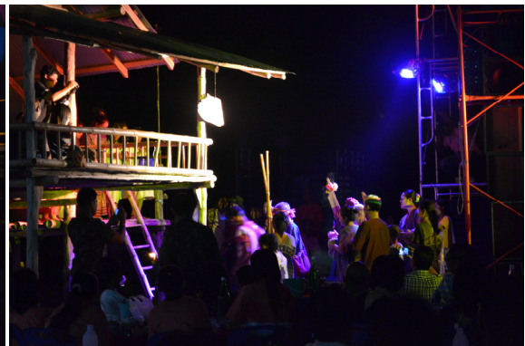
การแสดงประเพณีย่องสาวและประเพณีแต่งงาน ในงานประเพณีกินข้าวห่อบ้านโป่งกระติงบน วันที่ ๓ สิงหาคม ๒๕๕๗