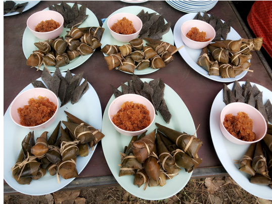
ข้าวห่อที่ต้มสุกแล้วและน้ำจิ้ม

วันที่ ๒ จะเริ่มต้มข้าวห่อด้วยหม้อ ปี่ปหรือกระทะแล้วแต่สะดวก น้ำจิ้มก็ใช้มะพร้าวขูดใส่น้ำตาลหรือน้ำผึ้ง เคี้ยวหวานเป็นหน้ากระฉีก