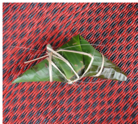
ข้าวห่อตัวเมีย