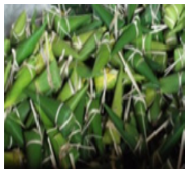
ข้าวห่อธรรมดา