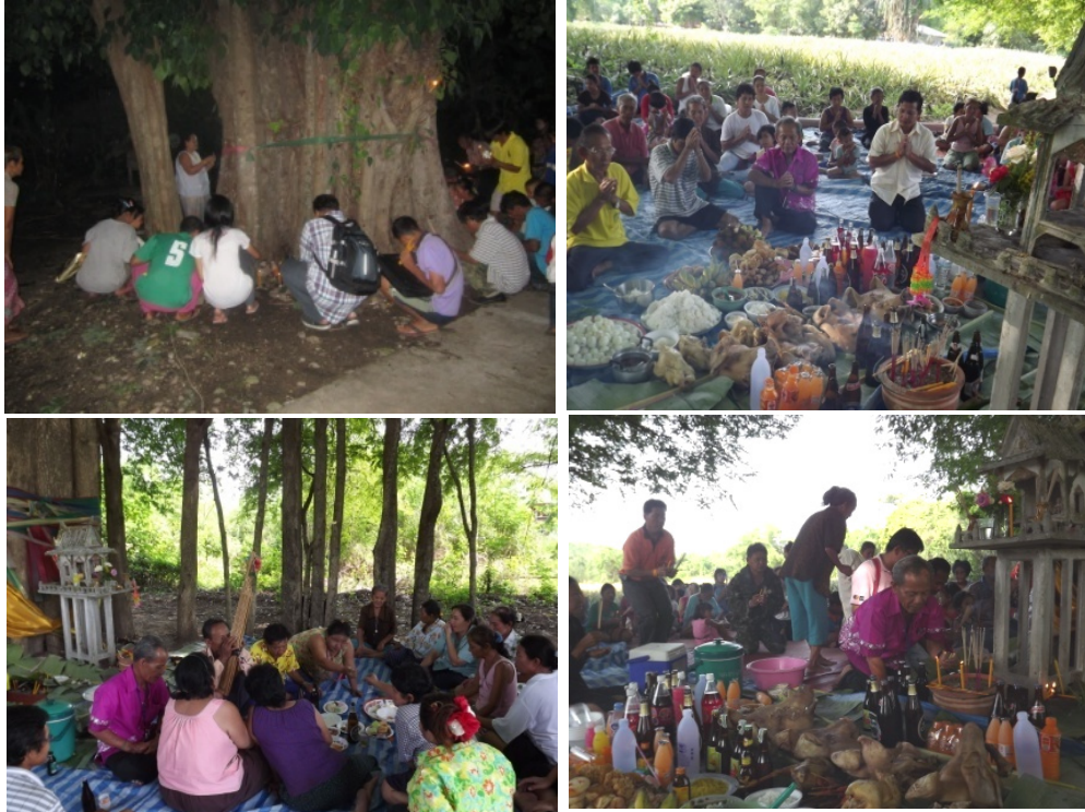
พิธีกรรมไหว้ต้นไม้ของชาวกะเหรี่ยงบ้านโป่งกระทิงบน

เมื่อถึงวันนัดหมาย ผู้คนในหมู่บ้านมาชุมนุมกันที่ต้นไม้ประจำหมู่บ้าน เชื้อคู้จะเป็นสะพานเชื่อมชีวิต กับ อำนาจเหนือธรรมชาติ เป็นผู้ประกอบพิธีเริ่มด้วยจุดธูปเทียนนำมาแล้วทุกคนจุดตาม บอกกล่าวเชิญรุกขจี้อมารับของเซ่นไหว้ ขอให้ช่วยคุ้มครองคนในหมู่บ้านให้อยู่เย็นเป็นสุข แล้วนำธูปเทียนไปปักที่โคนต้นไม้ใหญ่ จากนั้นเชื้อคู้จะหยิบข้าวปลาอาหารที่นำมาอย่างละนิดหน่อยวางบนแคร่ไม้ พलगเชื้อเชิญรุกขจี้อมารับของเซ่นไหว้