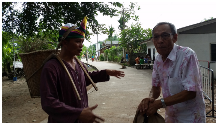
“โง” ภาชนะจักสานของชาวไทยกะเหรี่ยง

การเลือกพันธุ์ข้าวของชาวไทยกะเหรี่ยงเป็นพันธุ์ที่มีเฉพาะสำหรับการปลูกพืชไร่เพราะต้องใช้น้ำน้อย ทนต่อความแห้งแล้ง มีชื่อเฉพาะ อาทิ “บั้งอั้ง เจ่งผั่วคู้” แปลเป็นภาษาไทยได้ว่าข้าวคัดพันธุ์ใหญ่ และพันธุ์ “เอ่ยวองฟั้งคู้” แปลเป็นไทยได้ว่าข้าวพันธุ์เล็ก และยังมีพันธุ์อื่นๆ อีก ๒-๓ พันธุ์ และเมื่อข้าวรวงได้ ก็จะทำกรนวดข้าวโดยใช้โรงนวดข้าว (เจียงโยบั้ง) จะไม่มีวิธีนวดข้าวเหมือนคนไทยโรงนวดข้าวจะเหมือนบ้าน มีไต้ถุนสูง หลังคามุงแฝกหรือสังกะสี พื้นที่ชั้นบนของโรงนวดข้าวจะใช้ไม้ตีผาต่างๆ เมื่อเหยียบย่ำข้าวเปลือก (บั้ง) ให้ตกลงมาชั้นล่างจะใช้ลำแพน (โคล้) รองรับข้าวที่ตกลงมาจากชั้นบนแล้วใส่โง (ภาชนะคล้ายกระบุงแต่สูงกว่า) แบกกลับบ้าน วิธีการแบกจะใช้หน้าผากคล้องเชือกที่ผูกติดกับตัวโง ตัวโงจะอยู่บนหลังใช้แรงศีรษะ และคอเป็นตัวยกกริยาการยกของในลักษณะนี้ก็เลยเรียก “โง” จะแตกต่างจากชาวมอญที่นิยมยกของหนักไว้บนศีรษะ เมื่อนำกลับมาถึงบ้านแล้วก็จะนำข้าวเปลือกใส่ไว้ในถังข้าว (บั้งฟั้ง) บ้านโบราณของชาวไทยกะเหรี่ยงจึงมีถังข้าวกันทุกบ้าน แต่ในปัจจุบันเนื่องจากไม่ได้ทำนาความจำเป็นที่จะรักษาถังข้าวและโรงนวดข้าวไว้ก็หมดความจำเป็น