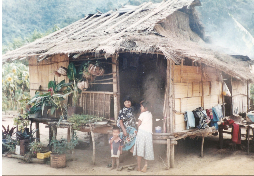
ลักษณะบ้านของไทยกะเหรี่ยง ภาพถ่าย ณ บ้านผาปก อำเภอสวนผึ้ง วันที่ ๑ กันยายน ๒๕๓๙