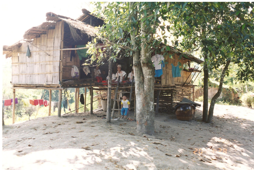
ลักษณะบ้านของไทยกะเหรี่ยง ภาพถ่าย ณ บ้านบ่อหวี อำเภอสวนผึ้ง วันที่ ๒๐ สิงหาคม ๒๕๔๘