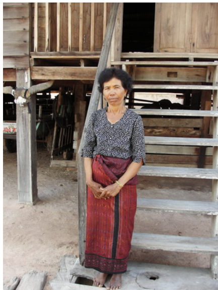
หญิงไทยเชื้อสายเขมรวัยกลางคนสวมเสื้อลายดอกไม้เล็กๆแบบสมัยนิยมนุ่งผ้าโฮลปะโบล นิยมสวมใส่ในโอกาสงานบุญต่างๆ

เสื้อดังกล่าวนี้มีลักษณะคล้ายกับเสื้อของคนไทยในเชื้อสายวัฒนธรรมลาวและส่วย ซึ่งปัจจุบันนี้คนเขมรยังนิยมการใส่เสื้อที่ทันสมัยขึ้นโดยการตัดเย็บด้วยจักร นิยมตัดเป็นเสื้อผ้าลายลูกไม้และลายดอกไม้เล็กๆมีสีสันทันดูจะเข้มๆสดๆครึ้มๆตามแต่วัย ส่วนใหญ่แล้วจะเป็นวัยกลางคนถึงวัยสูงอายุ ซึ่งจะเน้นเป็นแขนกระบอก ส่วนสาว ๆ วัยรุ่นจะใส่เสื้อตามสบายที่เหมาะสม ซึ่งปัจจุบันผ้านุ่งยังคงนุ่งผ้าตามแบบโบราณดังที่กล่าวข้างต้น