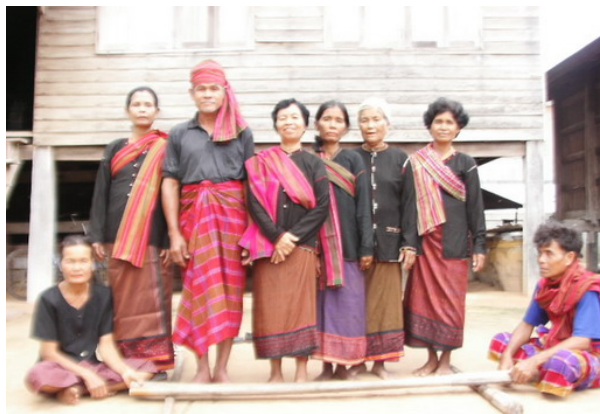
การแต่งกายแบบเขมรโบราณชายหนุ่มโสร่ง หญิงสวมเสื่อเก็บนุ่งผ้าถุงปะโบลผาดบ่าด้วยผ้าขาวม้า จดอในการละเล่นลูกอ้นแร ของชาวไทยเชื้อสายเขมรอีสานใต้

กว่า “เทอแซว (การทำตะเซ็บ)” ซึ่งด้วยที่เย็บจะตัดสี่ของเสื่อคู่สะดุดตาสวยงาม และที่คอเสื่อจะทำเป็น ลวดลายตามจินตนาการที่สวยงาม และที่สำคัญอย่างยิ่งของเสื่อแบบนี้คือ กระจดุมเสื่อจะทำจากเงินพดด้วง เขมรเรียกว่า “ปรักตม” มีจำนวนตั้งแต่ ๕ ถึง ๑๐ เม็ด ซึ่งเม็ดเงินที่ติดบนเสื่อนี้จะบ่งบอกถึงฐานะความมั่งคั่ง ของคนสวมใส่ ขนาดของเม็ดเงินก็จะแตกต่างกันออกไป และเสื่อดังกล่าวจะมีน้ำหนักมากจากความหนาของ เนื้อผ้าแล้วบวกกับน้ำหนักของจำนวนเม็ดเงินที่ติด สิ่งนี้เองยังมีคติอุบายความเชื่อของคนเขมรโบราณว่า “ยิ่ง ร่ำรวยมั่งมีมากเท่าใดภาระหน้าที่ความรับผิดชอบยิ่งมีมากเท่านั้น” เมื่อใส่เสื่อนี้แล้วจะเป็นการเตือนสติทุก ครั้งเพราะความหนักของเสื่อ