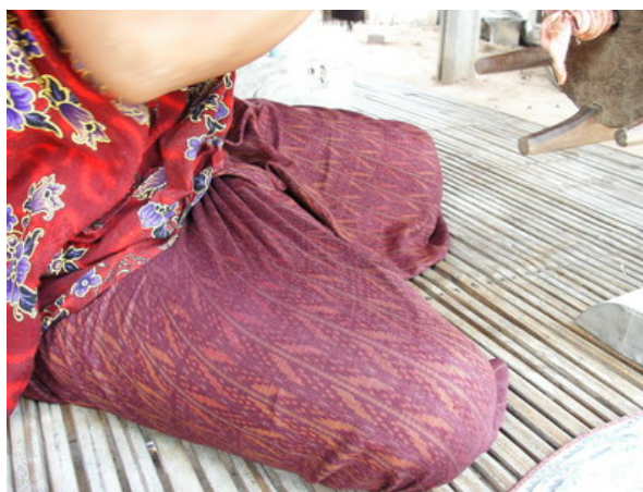
หญิงวัยกลางคนชาวไทยเชื้อสายเขมรนุ่งผ้าโฮลจำเรียกปะเดา(ผ้าโฮลลายผ้าหวาย)ผ้าถุงที่ขึ้นชื่อของ ชาวไทยเชื้อสายเขมรนั่งกวักไหมเข้าอีก

“อ่าวเก็บ” จะสวมใส่กับ ผ้าถุงไหมเขมรอย่างสวยงามไม่ว่าจะเป็นผ้าสมอ สกฏอันปรมกระเนียว ผ้าโฮล โดยเฉพาะผ้าโฮล ผ้ากระเนียว ซึ่งจะนำมาต่อหัวผ้าถุงเรียกว่า “กบาลซั่มปัด” และต่อเชิงผ้าถุง เรียกว่า “ปะโบล” และที่ปะโบลนี้มีผ้าที่เรียกว่า “ผ้าสะเล็ก” ซึ่งมีน้ำหนักทอจากฝ้ายติดต่อกันที่ปลายปะโบล เพื่อให้ผ้าไหมทั้งตัวดูพริ้วยิ่งขึ้น เหตุที่ต้องต่อหัวผ้าถุงและเชิงผ้าเนื่องจากผ้าทอในสมัยโบราณจะมีหน้าพิน ก็ที่ แคบเวลานุ่งจะมีขนาดสั้นจึงต้องใช้ผ้าเหล่านี้มาต่อให้ยาวขึ้นและยังทำให้เกิดความสวยงามมากยิ่งขึ้น