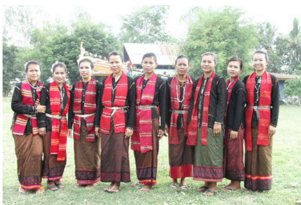
การแต่งกายแบบโบราณของพี่น้องชาวไทยเชื้อสายเขมรซึ่งสวมเสื้อเก็บ นุ่งผ้ากระเนียว ผ้าโฮลปะโบลในงานประเพณีบุญบั้งไฟในเขตอำเภออุบลรัตน์ จังหวัดศรีสะเกษ

การแต่งกายของชาวไทยเชื้อสายเขมรที่อีสานใต้นั้นมีเอกลักษณ์เฉพาะตัว อันบ่งบอกถึงความเป็นท้องถิ่นเขมรอีสานใต้ได้อย่างน่าชื่นชม ไม่ว่าจะเป็นเสื้อ ผ้านุ่ง เป็นสิ่งที่แสดงถึงมรดกตกทอดจากรุ่นปู่ย่าตายายมาสู่รุ่นลูกหลาน นับแต่สมัยโบราณกระทั่งกว่าร้อยปีหลังถึงปัจจุบัน การแต่งกายของชาวไทยเขมรได้เปลี่ยนแปลงไปไม่น้อย แต่ ณ ปัจจุบันลูกหลานที่หวงแหนในวัฒนธรรมการแต่งกายของคนเขมรได้รื้อฟื้นช่วยกันกลับมาสวมใส่แต่งกายกลับมาเป็นที่นิยมกันอย่างมากขึ้นในโอกาสงานบุญและงานประจำปีต่างๆ ในสมัยโบราณหญิงชาวเขมรในอีสานใต้ก็มีความพิถีพิถันในเรื่องกายแต่งกายเช่นเดียวกับหญิงในภาคอื่นๆ ของไทยไม่แพ้กัน ดังจะเห็นได้จากเสื้อที่สวมใส่ ได้จากการตัดเย็บด้วยฝีมือล้วนๆ และที่ขาดไม่ได้คือผ้านุ่งที่มีเอกลักษณ์มาแต่โบราณสวยงามไม่ว่าจะเป็นผ้าสมอ ผ้าสกุ ผ้ากระเนียว ผ้าอันปรม ผ้าโฮล ผ้าเก็บ ผ้าจดอก ผ้าโสร่ง