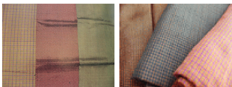
ผ้ายสาคุ ผ้ายอันปรม ผ้ายสมอ ผ้ายสมอสีเหลืองทองและเขียว,ผ้ายสาคุ

ผ้าชนิดนี้สันนิษฐานว่าน่าจะเป็นผ้าที่มีการรู้จักทอพุ่งเป็นลายรุ่นแรกๆ ผ้าในกลุ่มที่ใช้เทคนิคการทอลักษณะนี้ ได้แก่ ผ้าจะป็นขวร อันลุนซิม(ลายสยาม) ผ้ากระเนียวผ้ายดั่งกล่าวผู้หญิงทุกวัยนิยมนำนุ่งกันในชีวิตประจำวันแต่ถ้าเป็นโอกาสสำคัญจะใช้ผ้ายดั่งกล่าวนี้ต่อเชิงผ้านุ่งอย่างสวยงาม ผ้ากระเนียวกอเตีย (ผู้ชายใช้นุ่งโจงกระเบน) ผ้ายลายอันลุน หรือผ้ายลายตารางซึ่งใช้ไหมพุ่งและไหมยืนหลายสีแบบเดียวกันทอขัดกัน เกิดเป็นตาราง ถ้ามีขนาดใหญ่เรียกว่า อันลุนธรม ถ้าขนาดเล็กเรียกว่าอันลุนตุ้จ เป็นลายผ้าที่รู้จักทอพุ่งรุ่นถัดมาซึ่งสับซ้อนขึ้นมาหน่อย กลุ่มผ้าทอแบบนี้มีลายผ้าต่างๆกันเช่น ผ้ายสมอ ผ้ายสาคุ ผ้ายดั่งกล่าวนิยมใช้ในกลุ่มหญิงสูงวัยใช้นุ่งอยู่บ้าน เช่น ผ้ายอันปรม