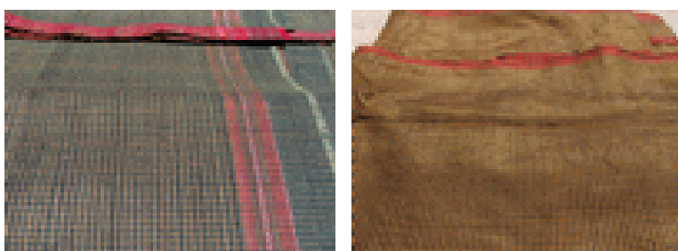
ผ้ายสมอสีเขียว