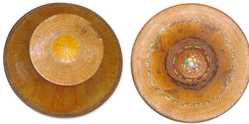
งอบอาสาด้านนอกและด้านใน

7) งอบอาสา งอบอาสา เป็นที่บังแดดบังฝนเมื่อเวลาออกนอกบ้าน ปีกกว้างทำให้ปกกันแดดและฝนได้ดี โครงของงอบสานด้วยลายฉลุหรือลายตาชะลอม และใช้ใบลานเย็บทับโครงงอบ ความละเอียดของงอบอยู่ที่ฝีเข็มของการเย็บงอบ เช่น 15 17 19 ฝีเข็ม ส่วนที่สวมศีรษะ เรียกว่า รังงอบสานด้วยไม้ไผ่ซีกเลียดให้เป็นเส้นกลมเป็นลายโปร่งทำให้อากาศถ่ายเทได้ดี ผู้สวมใส่จะไม่ รู้สึกร้อน ปัจจุบันบ้านโพหักไม่มีการทำงอบแล้ว หากต้องการจะใช้ก็จะซื้องอบสำเร็จรูป แล้วนำมาตกแต่งลวดลายการตกแต่งลวดลายภายในโครงงอบจะแทรกกระดาษอังกฤษสะท้อนแสงเพื่อเวลา สวมใส่กระดาษจะสะท้อนแสงเข้าใบหน้าผู้สวมใส่ทำให้หน้าवलนับว่าเป็นภูมิปัญญาของชาวโพหัก ที่ใช้เทคนิคการตกแต่งให้เกิดความพึงพอใจของผู้รับ ส่วนลวดลายที่ขอบงอบ จะใช้เส้นหวายที่ซีกเลียดนำมาสานเป็นลายขัดเพื่อความแข็งแรงและยึดติดตัวงอบกับขอบไม่ให้หลุดง่ายและมีความเป็นเอกลักษณ์และสวยงามยิ่งขึ้น