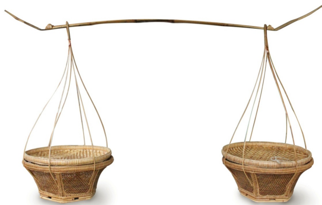
กระจาดหาบอาสาพร้อมกระโละและไม้คาน

3) กระจาดหาบอาสา เป็นหัตถกรรมเครื่องจักสานที่สานด้วยไม้ไผ่ใช้เป็นคู่มือสาแหรกที่ทำด้วยหวายทั้งเส้นรองรับ ต้องใช้ร่วมกับไม้คานสอดในส่วนบนของสาแหรกเป็นห่วงวางบนบ่าเพื่อแบกข้าวของไปไร่ไปนาหรือใส่สำหรับอาหารไปทำบุญที่วัด การสานลวดลายกระจาดอาสาสานด้วยลายตาฉลว มีลักษณะโปร่งเป็นตาหกเหลี่ยมทั้งใบ ตกแต่งที่ขอบปากด้วยหวาย ผูกขอบปากด้วยลายมัดหวายคู่และสานเป็นลายเส้นปลาซ่อน ด้านข้างขอบปากสานเป็นลายยายจูงหลานและเพื่อความแน่นหน้ายิ่งขึ้นใต้ขอบปากสานเป็นลายเกล็ดปลา ส่วนล่างใช้หวายสามเส้นซ้อนกันเฉพาะมุมทำเป็นฐาน ส่วนกันเป็นรูปทรงหกเหลี่ยม ใต้กันจะใช้ไม้ไผ่เหลาเป็นแท่งกลมปลายแหลมสอดรองเพื่อให้กันกระบุงมีความแข็งแรงมากขึ้น