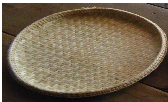
กระโละ

4) กระโละอาสา เป็นหัตถกรรมเครื่องจักสาน ที่มีลักษณะเหมือนกระดังแต่ขนาดจะเล็กกว่า ใช้สำหรับวางบนปากกระจาดหาบไว้วางของเช่น สำหรับกับข้าวเวลาไปทำบุญที่วัด ใส่ของหาบไปทุ่งนา เป็นต้น ขนาดของกระโละจะขึ้นกับกระจาดหาบ เวลาช่างจักสานหรือว่าที่เจ้าบ่าวจักสานจะสานให้เป็นชุดเพื่อให้เจ้าสาวได้ใช้ทั้งคู่ รูปทรงของกระโละเป็นทรงกลมลวดลายที่ใช้สานจะมีหลายลายตามความเหมาะสมหรือความสามารถของผู้จักสานได้แก่ ลายสอง ลายสาม ลายดีคว่ำ ลายดีหงาย การตกแต่งขอบปากเช่นเดียวกับกระบุงและกระจาดหาบซึ่งเป็นอัตลักษณ์ของจักสานอาสารบ้านโพธิ์หัก