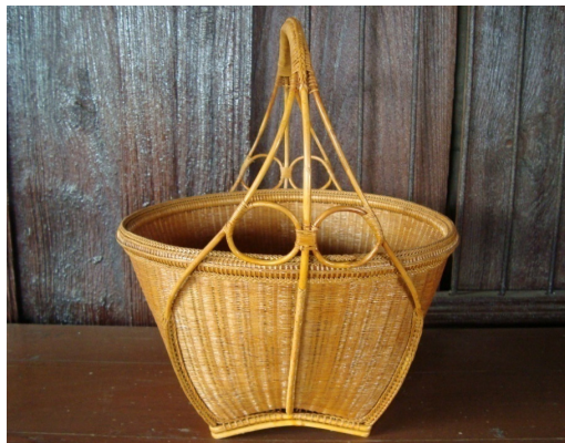
ตะกร้าหิ้วอาสา

2) ตะกร้าหิ้วอาสา เป็นหัตถกรรมเครื่องจักสานที่สานด้วยไม้ไผ่ทำขึ้นเพื่อใส่ของหิ้วไปตามที่ต่างๆหรือใส่ขนข้าวไปทำบุญที่วัด ลวดลายที่สานเป็นลายไหลซัดทึบหรืออาจจะเป็นลายผสมก็ได้เพื่อให้มีความแข็งแรงลวดลายตกแต่งที่ขอบปากมัดด้วยเส้นหวายเป็นลายมัดหวายคู่เป็นช่วงแต่มีความถี่มากกว่า กระบุงตกแต่งด้วยลายขอบปากด้วยลายสันปลาช่อนด้านบน ด้านข้างขอบลายยายจูงหลาน และถักลายเกล็ดปลาที่ใต้ขอบปากด้วยหวาย3เส้นเพื่อเพิ่มความคงทนของเครื่องจักสาน ส่วนของกันเป็นรูปทรงสี่เหลี่ยมจัตุรัส หูหิ้วใช้หวายทั้งเส้นมัดขดยึดเกาะอย่างแน่นหนา โอบไปรับน้ำหนักที่กันตะกร้า ด้านมือจับ ผูกหวายเป็นช่วงๆเป็นลายมัดหวายคู่ และตกแต่งด้วยลายสันปลาช่อนด้านบน