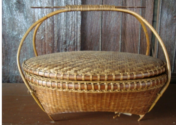
ตะกร้าเขี่ยนหมากอาสา

5) ตะกร้าเขี่ยนหมากอาสา เป็นหัตถกรรมเครื่องจักสานที่มีรูปทรงรูปไข่หรือวงรีมีฝาปิด สำหรับใส่ข้าวของเครื่องใช้ของสตรีทำหน้าที่เป็นกระเป๋าถือหรือใส่หมากพลูของผู้เฒ่าผู้แก่ส่วนลำตัวสานด้วยลายไหลขัดทึบ ขอบปากตกแต่งด้วยลายมัดหวายคู่และขอบบนตกแต่งด้วยลายสันปลาช่อน ฝาปิดสานด้วยลายสองตกแต่งขอบฝาด้วยลายมัดหวายคู่ หูหิ้วทำด้วยหวายทั้งเส้นตกแต่งลวดลายที่มีมือจับด้วยลายมัดหวายและสันปลาช่อน ก้นรูปทรงเป็นสี่เหลี่ยมผืนผ้าสานด้วยลายขัดตาโปร่ง บ้างก็จะสานลายขัดตาทึบแล้วแต่วัตถุประสงค์การใช้งาน