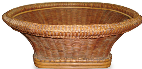
กระจาดกระเดียดอาสา

6) กระจาดกระเดียดอาสา เป็นเครื่องจักสาน ที่ใช้ประโยชน์เช่นเดียวกับกระจาดหาบ ต่างกันตรงที่ใช้ใส่แอมแล้วกระเดียดไปไหนมาไหนแทนการหาบ ลวดลายที่จักสานใช้ลายไหลขัดทึบหรือลายสานอื่นๆเช่นลายผสมระหว่างลายตีคว่ำและลายไหลหรือลายสองกับลายไหลเป็นต้น ส่วนปากกว้างและมีการรูปทรงกลม ลวดลายที่ตกแต่งขอบปาก เช่นเดียวกับกระบุงและกระจาดหาบซึ่งเป็นอัตลักษณ์ของจักสานอาสาบ้านโพธิ์หัก ส่วนก้นของกระจาดกระเดียดมีรูปทรงเป็นสี่เหลี่ยมจัตุรัส ใต้ก้นจะใช้ไม้ไผ่เหลาเป็นแท่งกลมปลายแหลมสอดตรงเป็นกากบาทที่มุมเพื่อให้ก้นกระจาดมีความแข็งแรงมากขึ้น