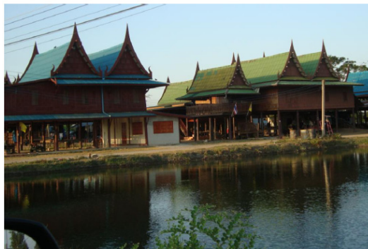
เรือนเครื่องสับ